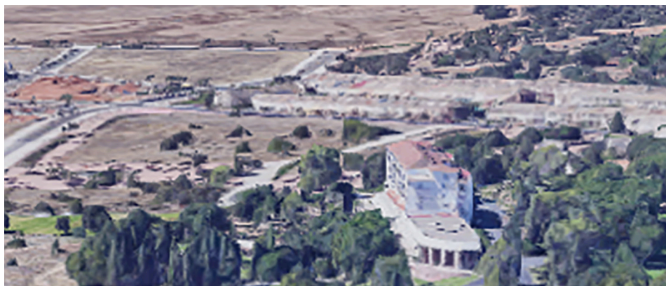
FIGURA 3. Imagen sobre el punto de salida de Ibn Firnás (Parador de Córdoba), orientado hacia el valle en dirección sur-sureste.

más sublime de la cultura islámica en aquella época y dominar la métrica y la composición era una de las cumbres intelectuales de la época, de una forma muy parecida al dominio de las artes plásticas de los artistas renacentistas.