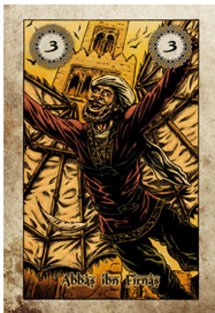
FIGURA 4. Detalle del juego «Córdoba».

se analizan los elementos de juego y se comprueba que las cartas que permiten ganar la partida están dedicadas a diferentes personalidades del mundo cultural de Córdoba, entre los que figura Ibn-Firnáas. Este proyecto no comercial, se desarrolló haciendo que el juego no pudiese comprarse, si no que, participando en actividades de la Asociación pudiese adquirirse. Junto con el juego, se incluía una pequeña reseña de los personajes mencionados para mayor valor histórico del proyecto. Puede que sea un homenaje compartido, pero también puede ser uno de los de mayor penetración sobre todo en edades jóvenes al asociar a través del juego la diversión y las ganas de aprender con un personaje de renombre de nuestra historia.