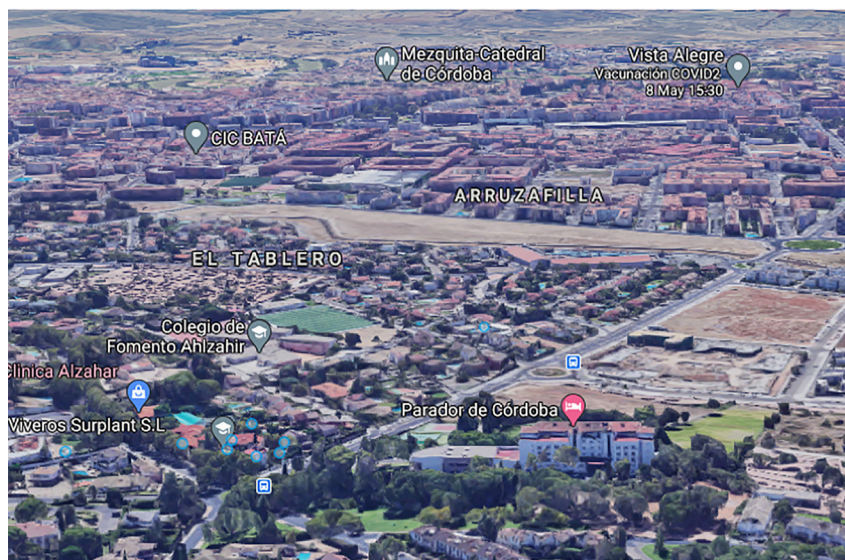
FIGURA 2. Imagen sobre el punto de salida de Ibn Firnás (Parador de Córdoba), orientado hacia el valle en dirección sur-sureste.