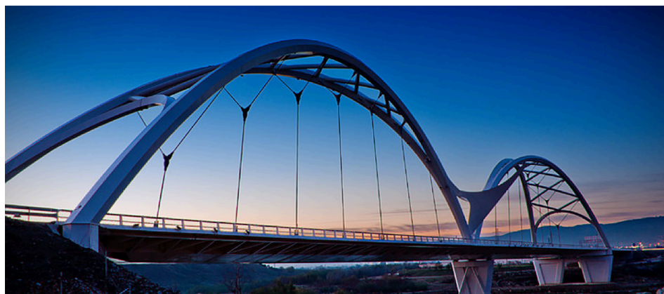
FIGURA 5. Puente dedicado a Ibn Firnás en Córdoba.

El puente, una construcción mixta entre puente con pilares y colgante se abre como las alas de un ave de lado a lado del puente y rinde homenaje a uno de los primeros trabajos completos sobre aeronáutica y aerodinámica de la historia.