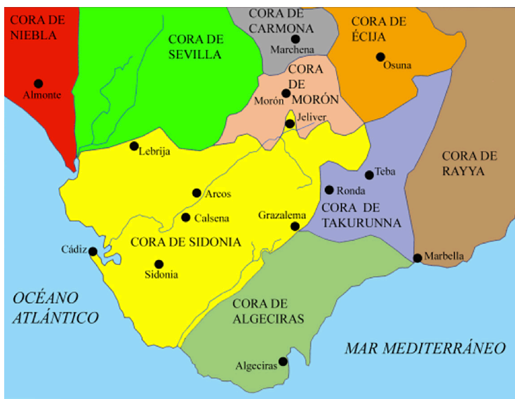
FIGURA 1. Ubicación de la cora de Sidonia.