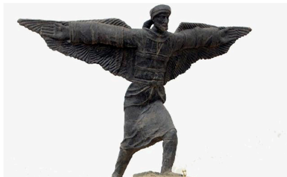
FIGURA 6. Estatua de Ibn Firnás en el aeropuerto de Bagdad.