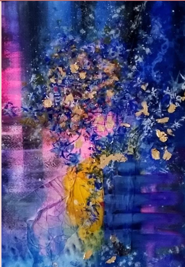
Acuarela de la autora