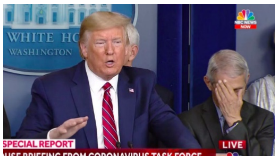
Figura 6.- Trump con Fauci, matrimonio de conveniencias en que la comunicación no verbal lo dice todo.

Suele ocurrir que acaban por ocupar lugares preeminentes en la jerarquía de los partidos aquellas personas que se han mostrado menos abiertas a la duda. Y este fenómeno ocurre con mayor contumacia cuanto menos madura es la sociedad. ¿Cómo puede establecerse, en tal caso, una deliberación eficaz entre dichos líderes