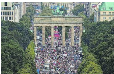
Fig.2.- Berlín, manifestación contraria al distanciamiento social. Agosto 2020.

Parece imposible negar la gravedad de la pandemia, pero negacionistas y conspiranoicos llenaron las calles de Berlín, el 1 de Agosto del 2020, (Figura 2, medios