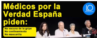
Fig.3.- Médicos por la verdad. Presentación pública.

George Lakoff: "La idea de que la gente abandonará sus creencias irracionales ante la solidez de la evidencia presentada ante ella es en sí misma una creencia irracional, no apoyada por la evidencia". El colectivo "médicos por la verdad" hace honor a esta