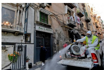
Figura 5.- Desinfección calles en la epidemia del COVID19

El cálculo utilitarista-pragmático, ¿puede hacer racional una creencia mágica?