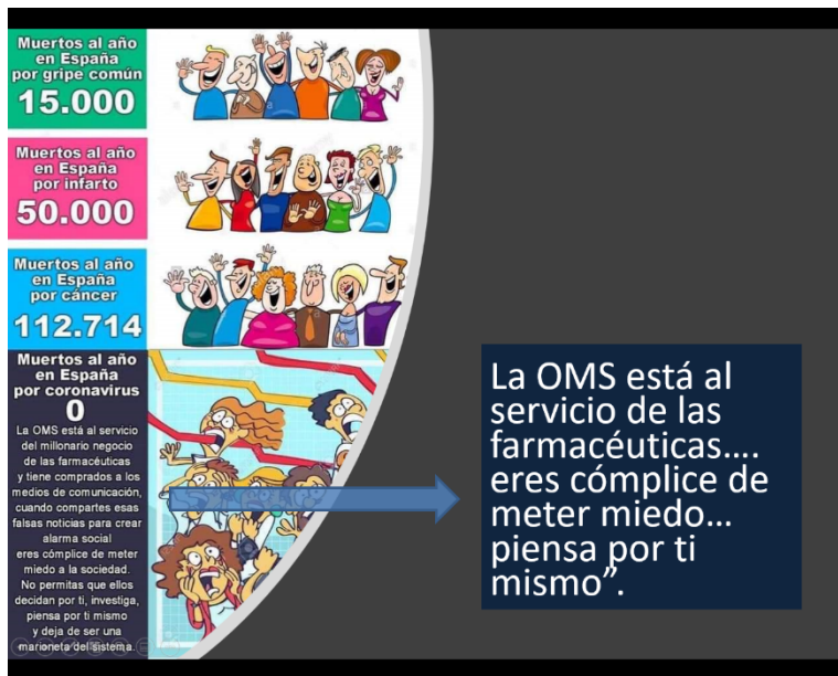
Fig.-4 Ejemplo de mensaje conspiranoico.

El ejemplo resulta interesante por varios motivos. En primer lugar, demuestra palmariamente que ser escéptico no implica practicar pensamiento crítico . Ayuda, pero no es suficiente. Solo si seguimos una metodología en la manera de argumentar, percibir o actuar, una metodología consensuada por los mejores, (los